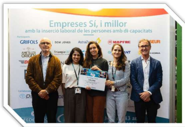
Lliurament del diploma de participació "Sí, i millor" a una empresa participant

Totes les organitzacions van rebre un diploma per la seva participació a l'edició 2025 de la Fira.