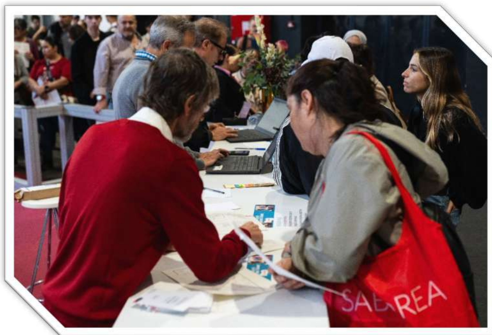
Taulell d'atenció al candidat que cerca feina dins de "Sí, i millor"